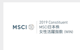
MSCI日本株女性活躍指数 (WIN)