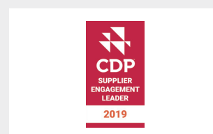
CDPサプライヤー・ エンゲージメント・リーダー・ボード