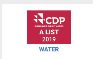
CDP水セキュリティAリスト