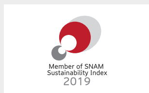
SNAM サステナビリティ・インデックス