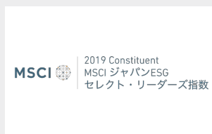
MSCIジャパン ESGセレクト・リーダーズ指数