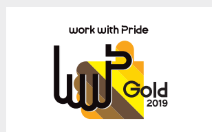
workwith Pride ゴールド認定