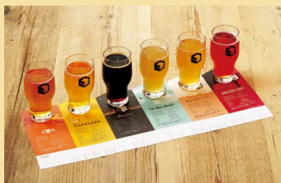
嗜好性、多様性、革新性を持った多彩なラインアップ