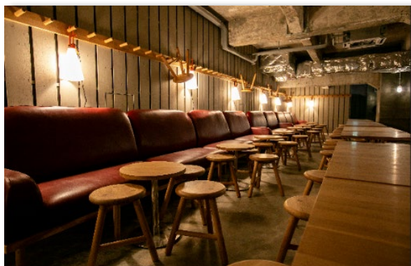
▲音楽やアートといった店内コンテンツが施され、「B」のユニークな空間を演出します。