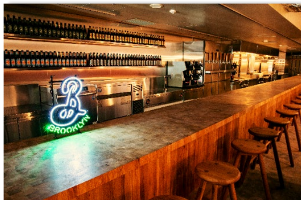
▲約20m程あるカウンターテーブル。

兜町にある1923年（大正12年）築の元第一銀行の建物「K5」の地下に「B」は出店します。建物はほぼ当時のまま残っており、重厚な風格は日本橋兜町の中でも異彩を放っています。破損が見られる部分以外は可能な限り残す予定です。