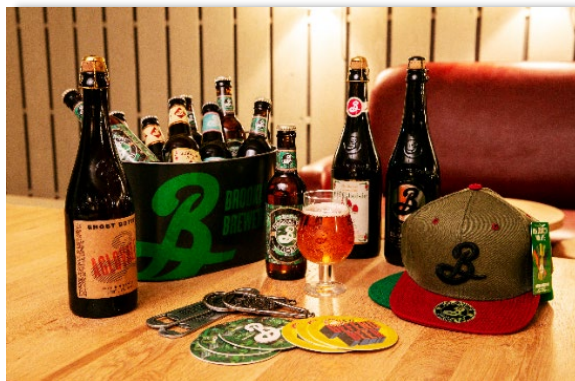
▲これまで国内では飲むことができなかった直輸入ビールをはじめ多様なラインアップをそろえています。