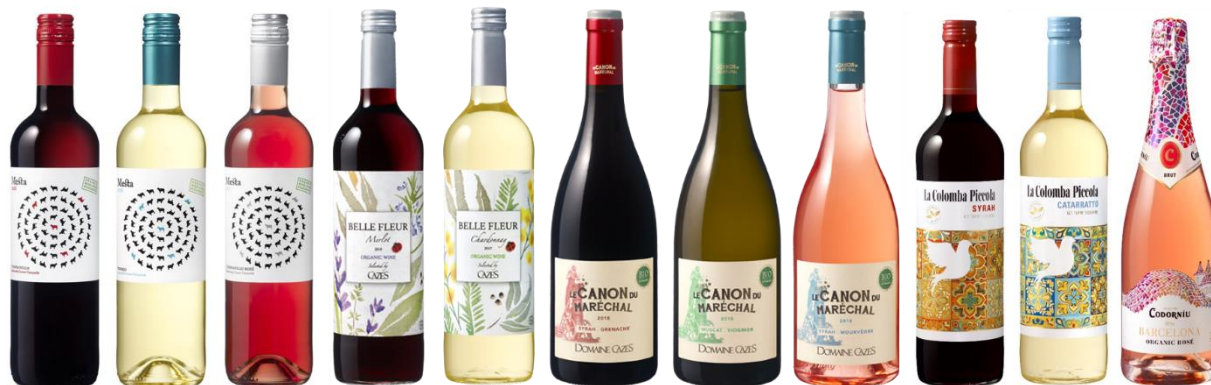
(1) 商品名・色・容器・容量・アルコール度数

当社は「メスタ オーガニック」、「ベル・フルール」、「ドメーヌ・カズ」、「ラ・コロンバ・ピッコラ」、「コードニユ バルセロナ 1872」などのオーガニックワインを多数ラインアップしています。