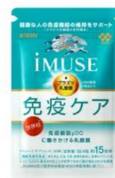
キリン iMUSE 免疫ケアサプリメント （15日分）

配布物：免疫ケアアリーフレット、キリン iMUSE 免疫ケアサプリメント（15日分）